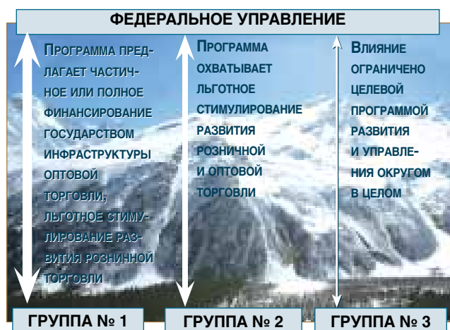
Рисунок 2 Глубина проникновения федерального влияния на развитие торговли

На рисунке 2 представлена глубина проникновения федерального влияния по представленным группам регионов Северо-Кавказского округа.