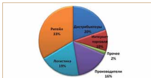
Рисунок 2 Структура спроса, 2012 год

В III квартале 2012 года совокупная площадь сделок аренды и купли-продажи на складском рынке Московского региона составила 500 000 м 2 . В общем объеме арендованных складов вот уже второй год подряд растет доля помещений, которые снимают логистические операторы. Это свидетельствует о том, что продолжает развиваться рынок логистических услуг, связанных с хранением грузов. По оценкам некоторых логистических компаний, объ-