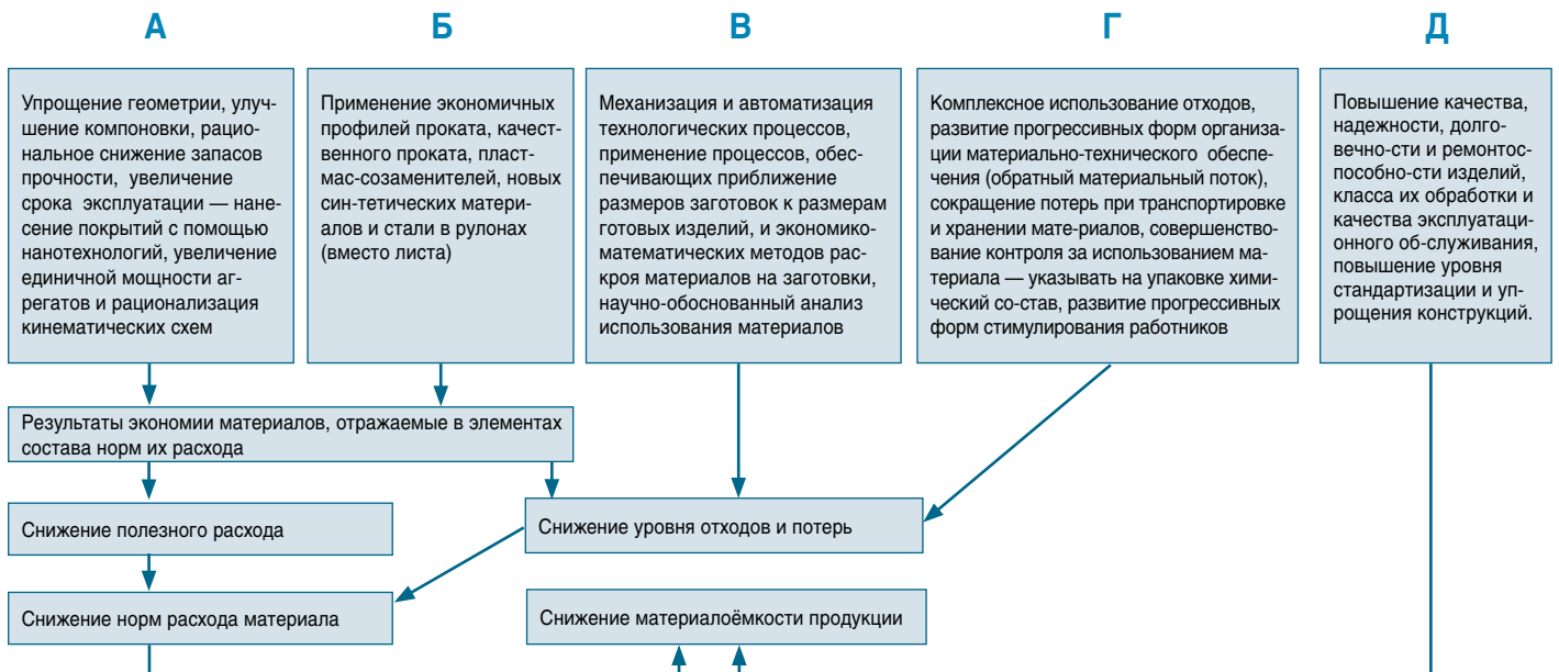
Рис. 2. Взаимосвязь источников, направлений и результатов экономии материалов.

Пути экономии материальных ресурсов влияют на величину нормы расхода каждого материала. Только на основе четкого разграничения и анализа каждого из таких направлений, знания их взаимосвязей можно выявить резервы снижения норм расхода и экономии материалов. Взаимосвязь источников, направлений и результатов экономии материалов показана на рис. 2. Источниками экономии материалов являются совершенствование конструкций изделий с заданными свойствами (А), примене-