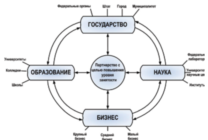
Рис.3. Модель макроэлементов НИС США

Американцы во всех сферах деятельности имеют иную кадровую политику. В отличие от россиян они продвигают только лиц с положительным опытом в конкретной области. У них понятие «своя команда» существует лишь в науке, в научных школах, в инновационных проектах и в бизнесе, где люди проверены, но не в госструктурах, где существование таких «команд» невозможно в принципе, что и у нас не допускалось в советский период. К, так называемым, эффективным менеджерам из других отраслей у них относятся с недоверием и нередко дают им испытательный срок. То, что в Америке исключение, у нас, к сожалению, широкая повседневная практика. Американцы генетически не воспринимают лиц, не имеющих конкретного опыта в конкретной сфере деятельности. И особенно сторонятся